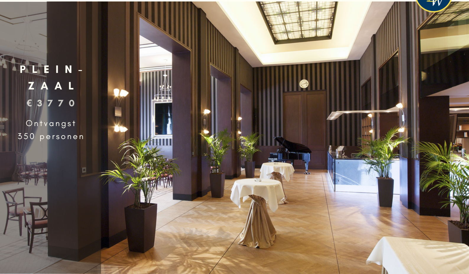
PLEIN - ZAAL € 3 7 7 0 Ontvangst 350 personen