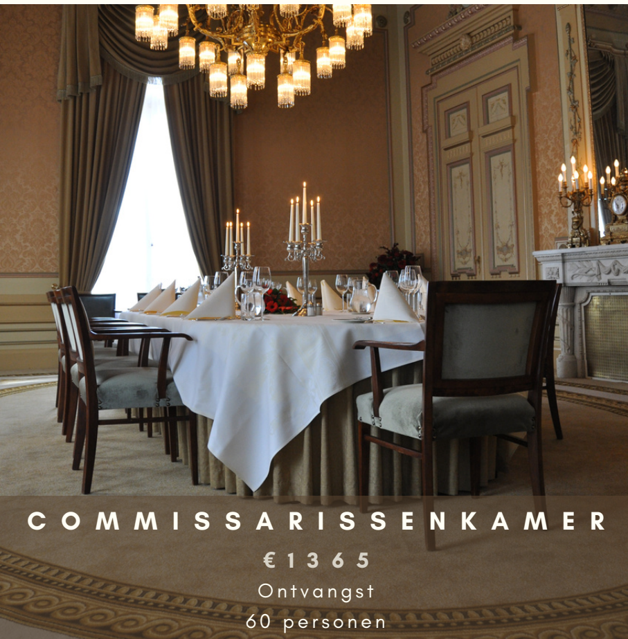
COMMISSARISSENKAMER € 1 3 6 5 Ontvangst 60 personen