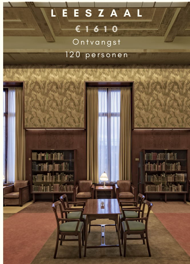
LEESZAAL € 1 6 1 0 Ontvangst 120 personen